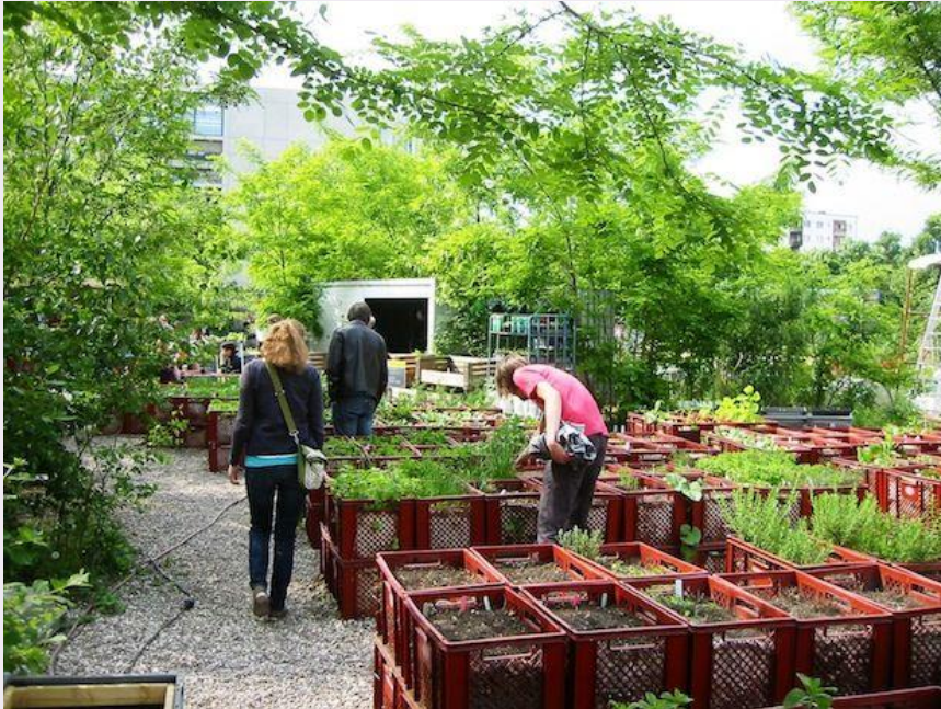
Project 'pluk de stad'